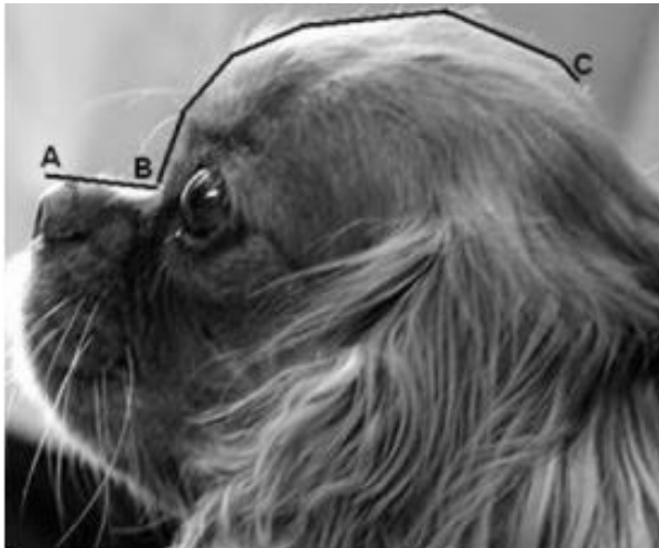
Abb. 2 Verhältnis Schnauzen-/Schädel­länge (aus Packer, 2014: S. 18)

Schnauzenlänge (Nasenspiegel bis Stopp) in mm X 100 = Schädel­länge (Stopp bis Kante Hinterkopf) in mm